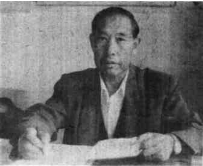
实施,地企联手,高标准治理的工程,建设方案,并将作为造福人民、惠及子孙的工程来抓,取得圆满成功。我们坚信,只要坚持市政府出政策,胜利油田出资金,高标准治理的工程,建设方案,并将作为造福人民、惠及子孙的工程来抓,取得圆满成功。

该项工程建设,在市委、市政府的正确领导下,在胜利石油管理局的大力支持下,在东营区政府的积极配合下,工程建设指挥部自1994年7月实施拆迁以来,精心组织,科学调度,规范施工,严把质量关,狠抓建管结合,组织市直、油田、东营区三方面22支施工队伍上阵,艰辛奋战一年多,高标准、高质量地完成了工程建设任务,于1995年9月18日顺利通过了全面竣工验收。这项造福油城人民的工程,共完成拆迁面积16000平方米;治理河道长度4174米,完成浆砌石3.55万立方米,开挖回填、调运土方37.14万立方米,混凝土773.1立方米;绿化河段1.3公里,植树2600株、冬青树两行2.6公里。五六干合排的成功治理,不仅提高了防洪能力,在今年汛期发挥了明显的排水作用,而且彻底改变了沿河两岸脏、乱、臭的状况,绿化、美化了西城的环境。为全市创建省级卫生城市增添光彩,得到油城人民的高度赞扬。