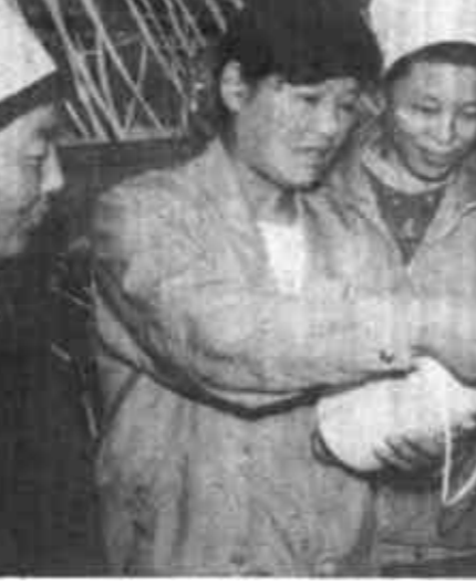
全市现场管理试点企业、东营市第二棉纺厂大胆加大改革力度，在全市首家推行“倒置成本管理”，用经济手段使干部职工真正树立主人翁意识，努力提高产品质量，降低成本，有效地促进了全厂扭亏增盈进程。图为车间领导们正在检查产品质量。

前不久，某单位在一次征求意见的会议上，一群众给一位领导同志提了三条意见，其中有的有点出人意料之外，会后好调查就乱放炮。”那位领导却心平气和地说：“挑刺嘛，出点血，带点肉，不能太计较。”笔者听后，对这位领导肃然起敬。我们开展批评，当然不提倡在挑剔时随便让其出血和伤好肉，但是这位领导正确对待批评的精神，无疑是可贵的。我们有些党员干