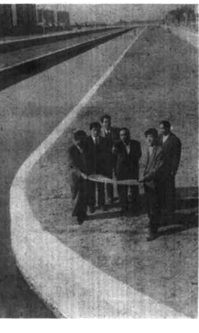
图为工程指挥部的领导与工作人员在工程现场研究河道治理规划。

施工合同,及时拨付工程资金等方面做了大量有效的工作,从而确保了工程的顺利实施。不可否认,五六干合排综合治理工程正因为决策者的正确领导、指挥者的勇于开拓、管理者们的科学调度、施工者的埋头实干与合作者的团结治水才变得异常的璀璨魅力。如果说拓河,那么这种开拓是全方位的;如果说效应,那么这种影响原本就无局限的界。毫无疑问,我市最近顺利通过“省级卫生城市”验收则为五六干合排工程作一良好的佐证。当省城来的省级卫生城市考核鉴定组专家学者站在五台山路桥,迎着飒飒秋风,眺望两边那整洁美观的河道似彩练蜿蜒到远方,看到一幅“蓝天映着河,洁净美油城”的真实印象时,会有什么感想呢?12岁的孩子们,请试想一下,倘若验收时间变到1994年7月29日之前,又会怎样呢?工程指挥部的一班人并未满足于眼前的成绩,他们冷静地坐下来召开联席会议座谈,赴发达城市考察城区河道的美化绿化,潜心研究第三期治理工程方案,审时度势地规划着新的发展蓝图。据说,这一蓝图,工程指挥部一班人正在描绘着:以河道为依托,以主要交通公路桥两侧为重点,以美化绿化为主要内容,建设桥头公园和条形风景带。